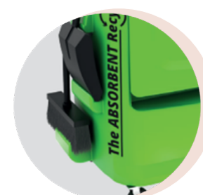
Pelle et balai avec leurs supports, rangements pour produits de propreté