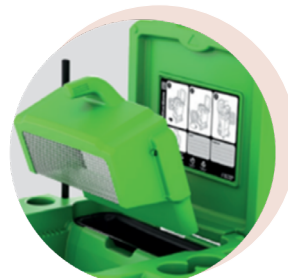
Le tamis se vide par basculement dans un bac de récupération des déchets